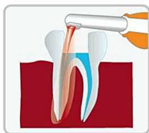
根の治療 (感染根管治療)