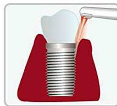
インプラント周囲炎