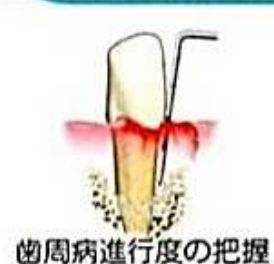
歯周病進行度の把握