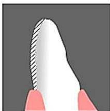
歯の表面を薄く削ります。