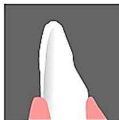
付け歯を歯に 接着します。