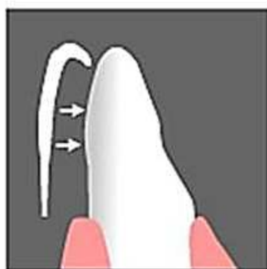
歯形をとり、 薄いセラミックの 付け歯を製作します。