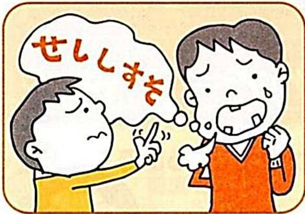
クセのある発音やしゃべり方は、乳歯がきれいに生えそろうていないことから起こります。