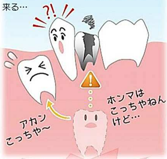
悪い歯並びは、見た目も悪く消極的な性格になったり、磨きにくいために虫歯や歯周病のリスクが増加します。